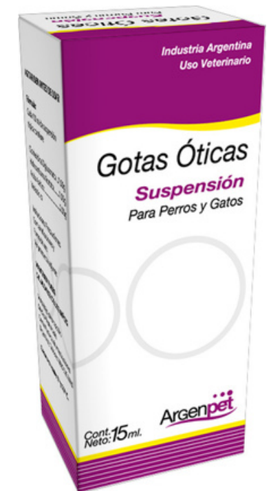
GOTAS OTICAS 15 ml