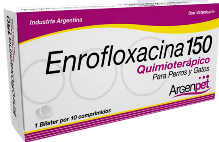
ENROFLOXACINA 150 10 TABLETAS