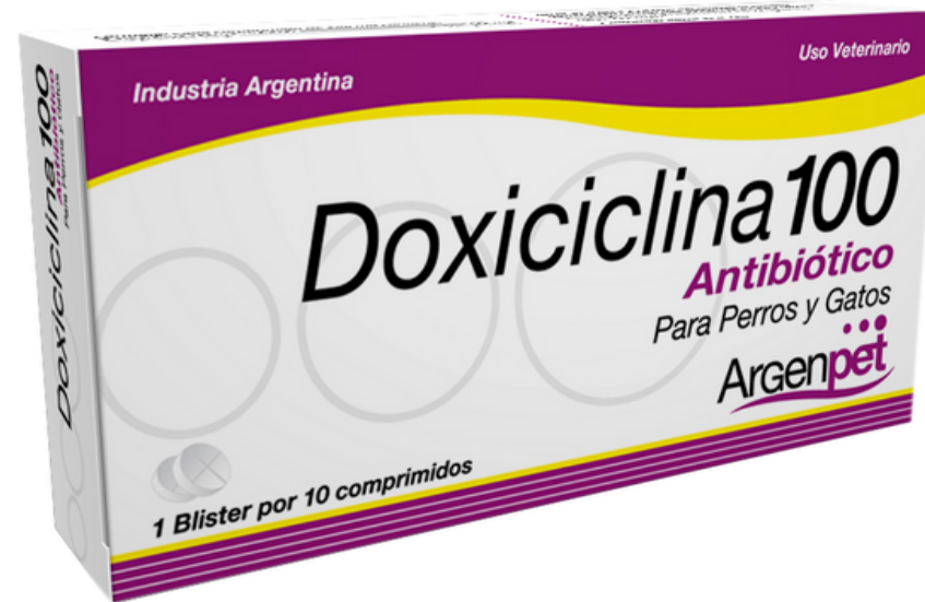
DOXICICLINA 100 10 TABLETAS