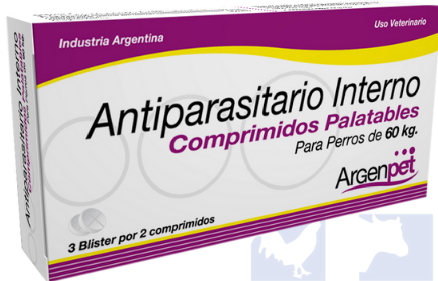
ANTIPARASITARIO INTERNO 6 TABLETAS 72 TABLETAS