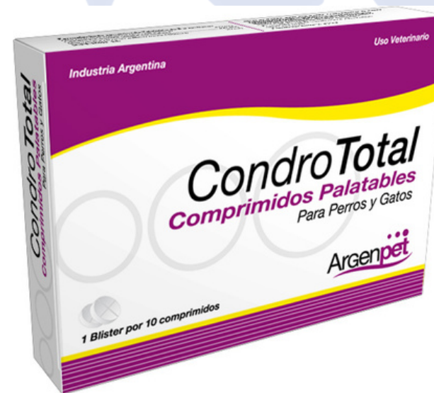
CONDRO TOTAL 20 TABLETAS